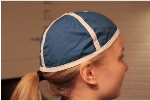
Väiskin hinta on 9,50€.