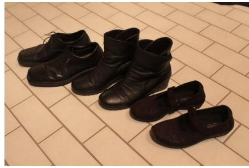
Esimerkkejä partioasuun sopivista kengistä.